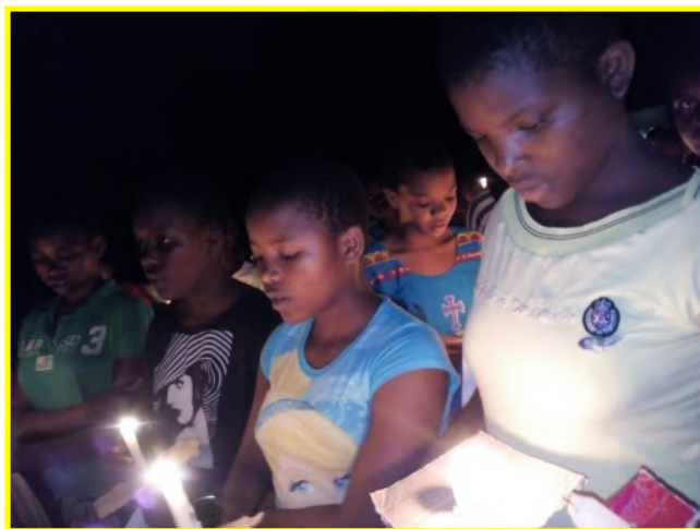
Celebrazione per la chiusura del mese del Rosario