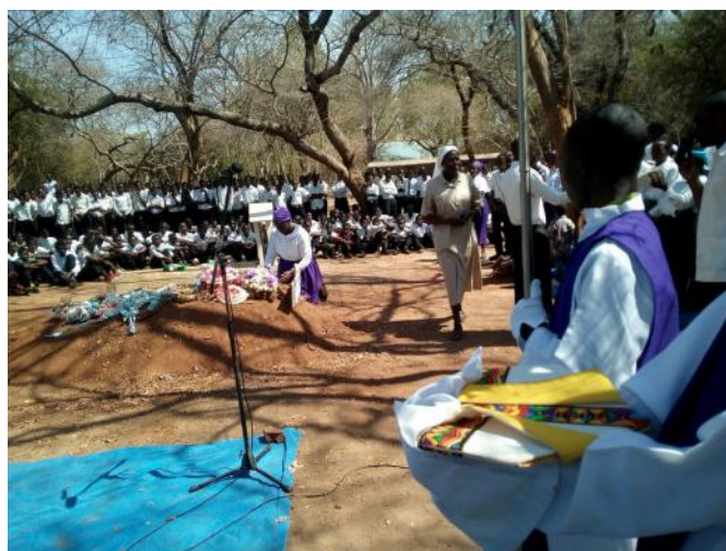
La commemorazione dei defunti